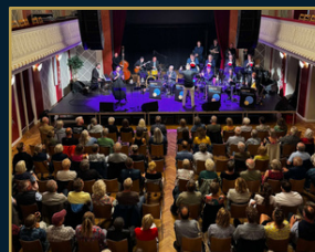
Borgerforeningen Svendborg Teater