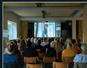
105 Bar & Køkken