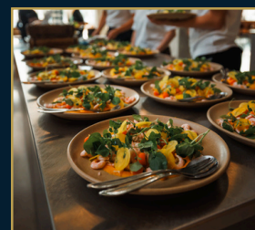
Smag på film