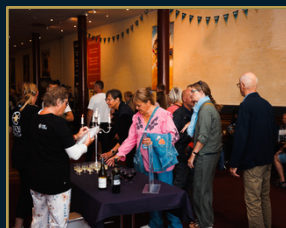
Biograf Scala Svendborg

I 2025 betød dette at publikum havde mulighed for at opleve arrangementer på 17 forskellige steder i og omkring Svendborg.