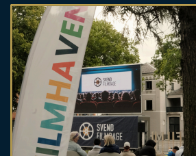
Krøyers Have (Filmhaven)