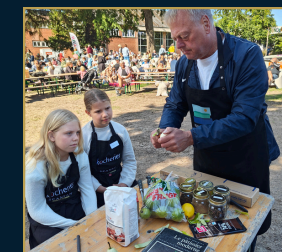
SVEND for børn