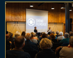
Det Maritime Pakhus